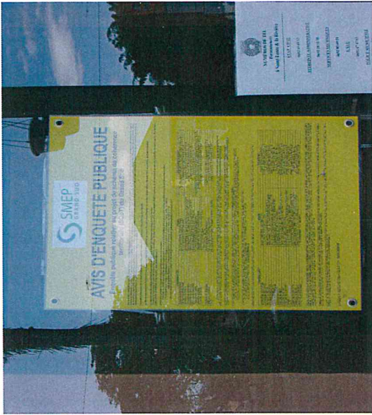
Affichage Mairie annexe de la Rivière