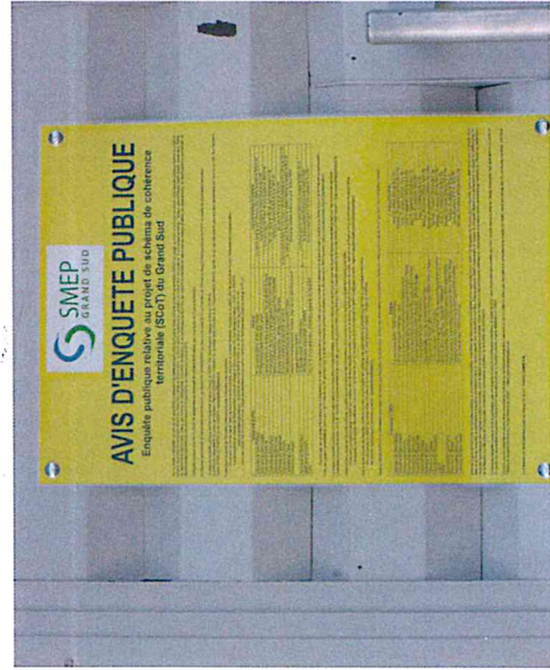
Affichage Mairie de Saint-Louis